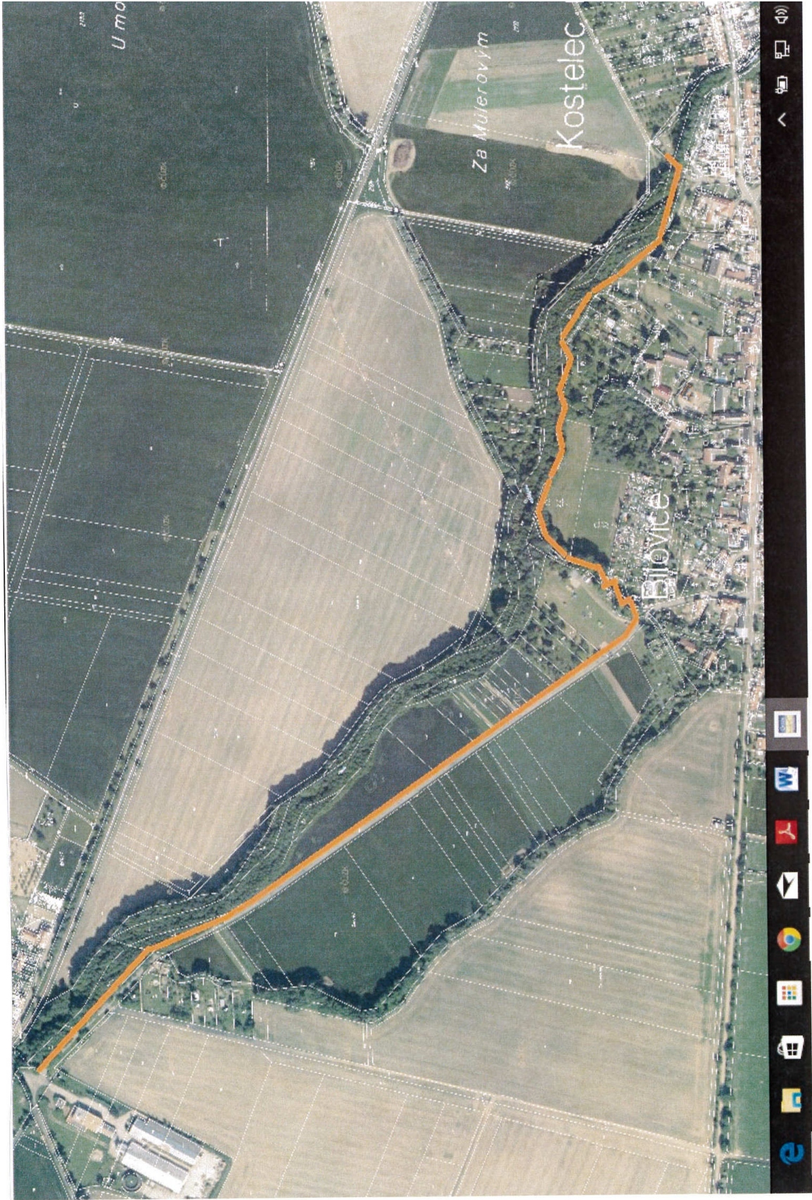
GRAFICKÁ PŘÍLOHA: lokalita č. 1.02 – doplnění trasy cyklostezky