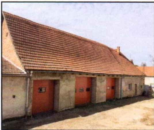
Opravená hasičská zbrojnice v Bílovicích