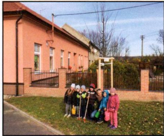
Sázení lípy ke 100 letům republiky