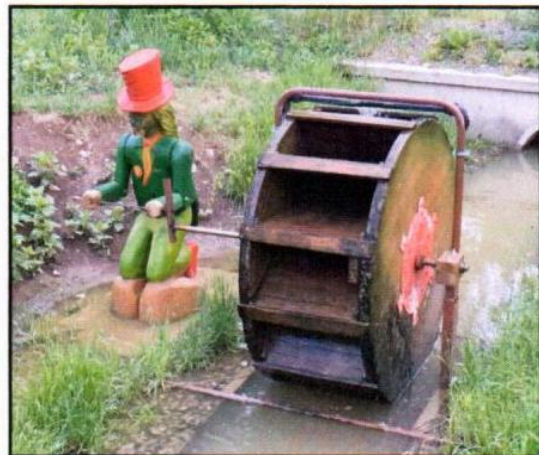
Vodník na mlýnském náhonu