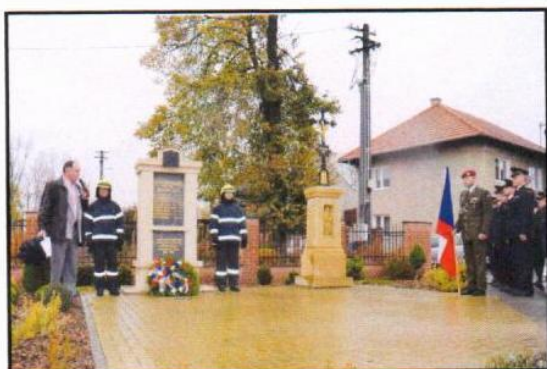
Pomník obětem válek