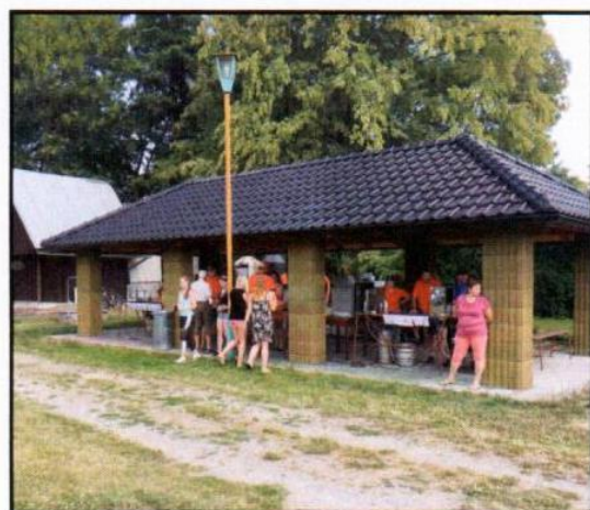
Pergola na hřišti v Bílovicích

Zpravodaj připravil a vydal: Obecní úřad Bílovice-Lutotín