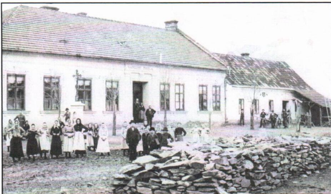
Národní škola v Bílovicích