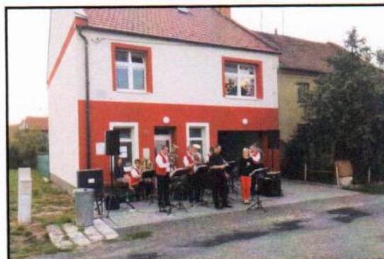
Předání garáže JSDH v Lutotíně