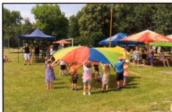
Vystoupení MŠ na dětském dnu