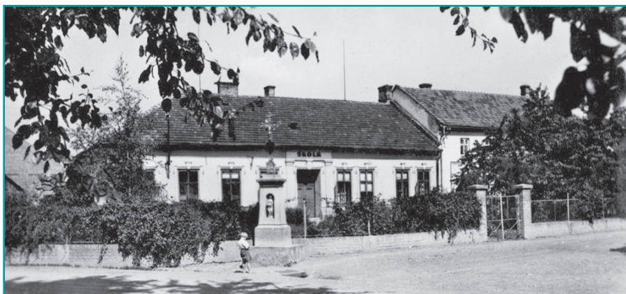
Historická fotografie školy v Bílovicích