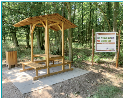
Stezky k Bílovskému hradu