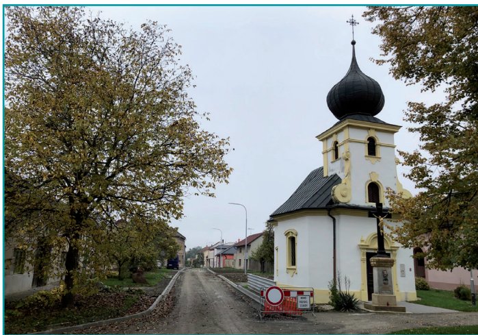
Opravy komunikací v obcích