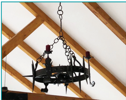
Kovaný lustr v KC Bílovice