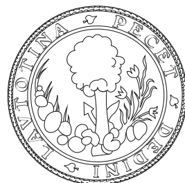
Historické pečete obcí Bílovice a Lutomíř