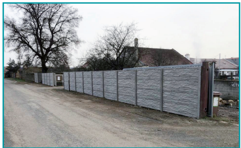
Oprava okolí Obecního úřadu v Bílovicích