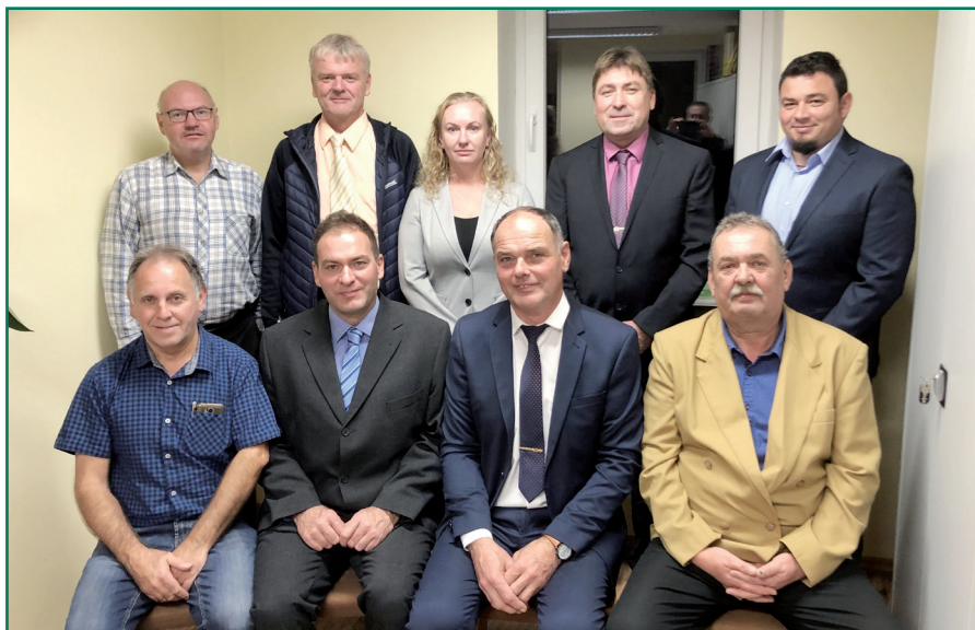
Nové zastupitelstvo obce