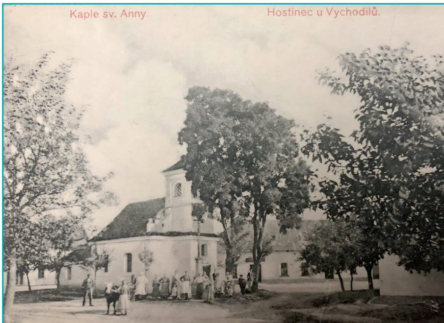
Historická fotografie kaple v Lutotíně