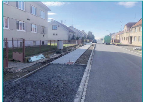
Výstavba chodníků v Bílovicích