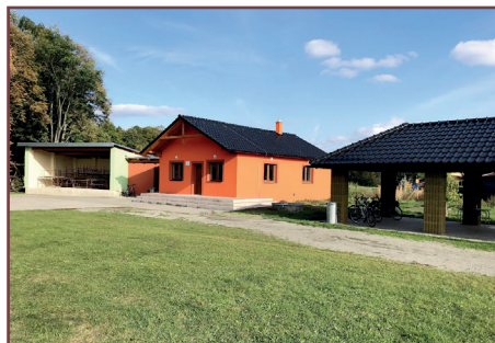
Chata na hřišti dřívě a nyní