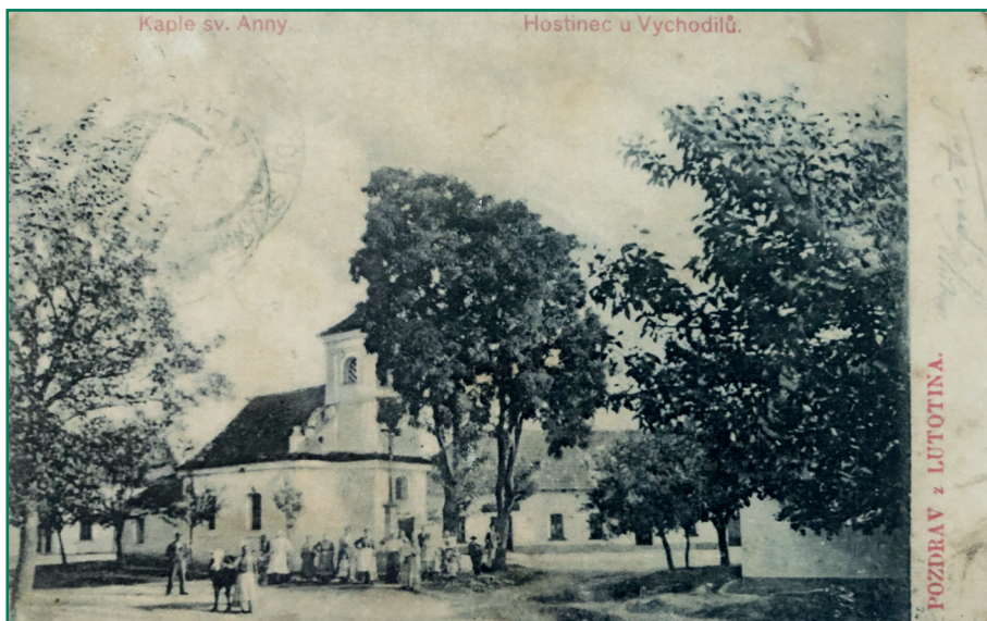
50. léta 20. století Lutotín - kaple