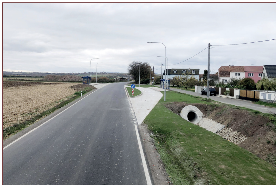
Autobusové zastávky na Lešanské silnici