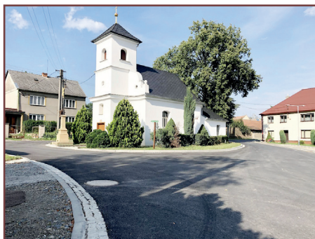
Lutotín náves dříve a nyní