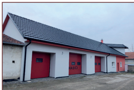
Hasičská zbrojnice dřívě a nyní