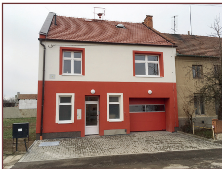
Původní obecní úřad v Lutotíně dříve a nyní