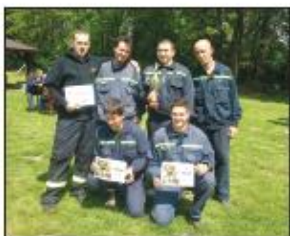
Soutěžní družstva SDH