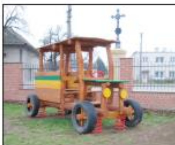
Zakončení léta a hřiště u Mateřské školy