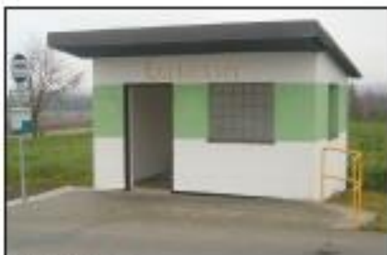
Oprava autobusových zastávek