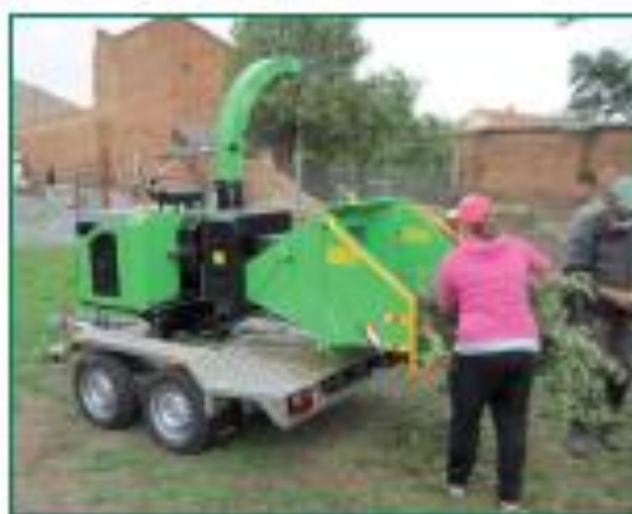
Nová Multikára se štěpkovačem